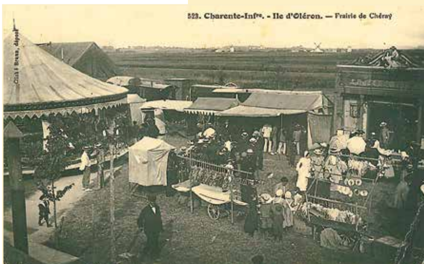
523. Charente-Inf. - Ile d'Oléron. - Frairie de Chéray