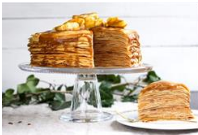
Gâteau de crêpes ☞

Viandes bovines d'origine France BIO = Issu de l'agriculture biologique IO = Issu de la production oléonaise ☞ = Fait maison