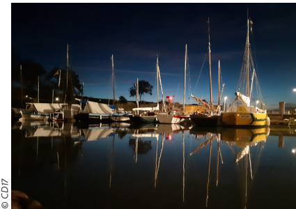
Port du Château d'Oléron, par Philippe LOMBARD.