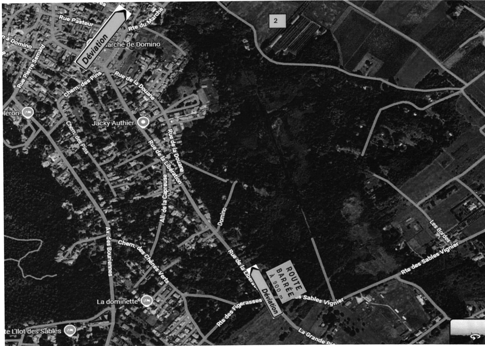
Annexe 01 de l'arrêté 2026-182-8.3.3