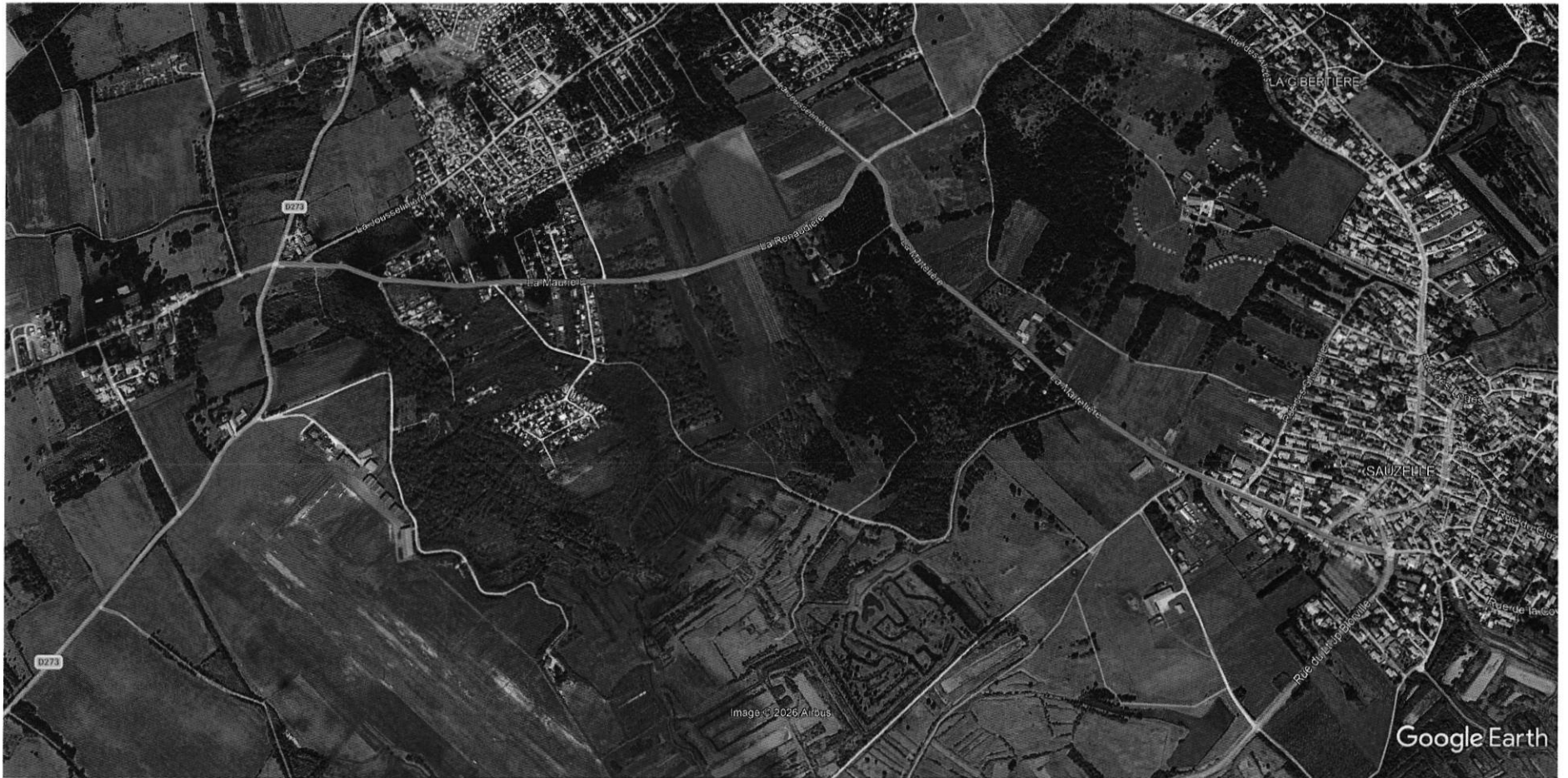
Annexe 01 de l'arrêté 2026-141-8.3.3