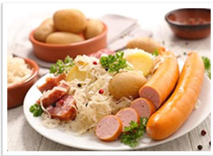
« Knacks et Choucroute☺ »

Compte tenu des difficultés d'approvisionnement, les menus sont susceptibles d'être modifiés