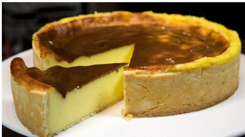
«Flan pâtissier ☞»

Compte tenu des difficultés d'approvisionnement, les menus sont susceptibles d'être modifiés